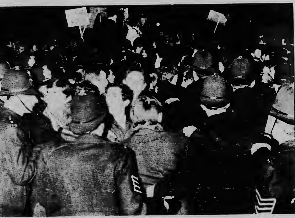
Polisan aki ta combatiendo contra grupo di demostrantenan durante un manifestacion cu tabatin bao di e lema "Paz pa Rhodesia". E suceso aki a tuma banda di e residencia oficial di promer minister Wilson, riba Trafalgar Square. --UPI -- Radiophoto--.

LONDRES--UPI--Polisan a sinta un bringamentu cu miles di manifestantenan den centro di e capital aki despues di un reunion na favor di e Gobierno blancu di Rhodesia.